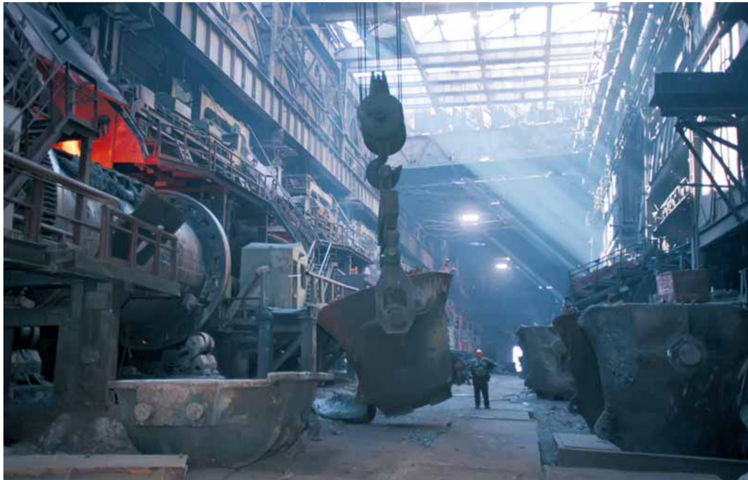
ЭТОТ ЗАВОД МОЖЕТ ПОЙТИ С МОЛОТКА В ЛЮБОЙ МОМЕНТ ПО ВОЛЕ СОБСТВЕННИКОВ

Почему так важно уйти от олигархической структуры экономики? Потому что хотя олигархат всегда действует по правилам, ко-