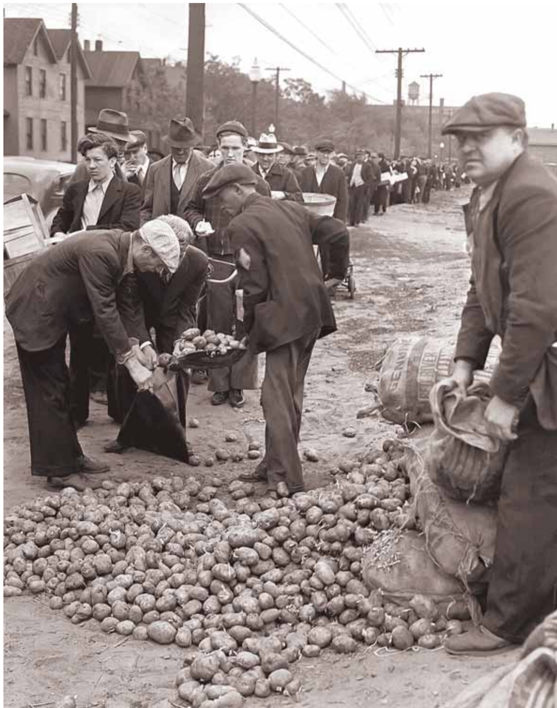
В 30-е годы в Америке картошка тоже была главным блюдом в рационе миллионов безработных

– Основной вопрос: будет ли девальвация рубля и когда? Если она произойдет до октября-ноября текущего года, у нас есть серьезный шанс улучшить ситуацию в экономике. Хотя все равно необходимо проводить экономические реформы. Если девальвации в эти сроки не будет, мы почти наверняка войдем в следующий год с исчерпанными денежными резервами. Тогда мы оказываемся в ситуации