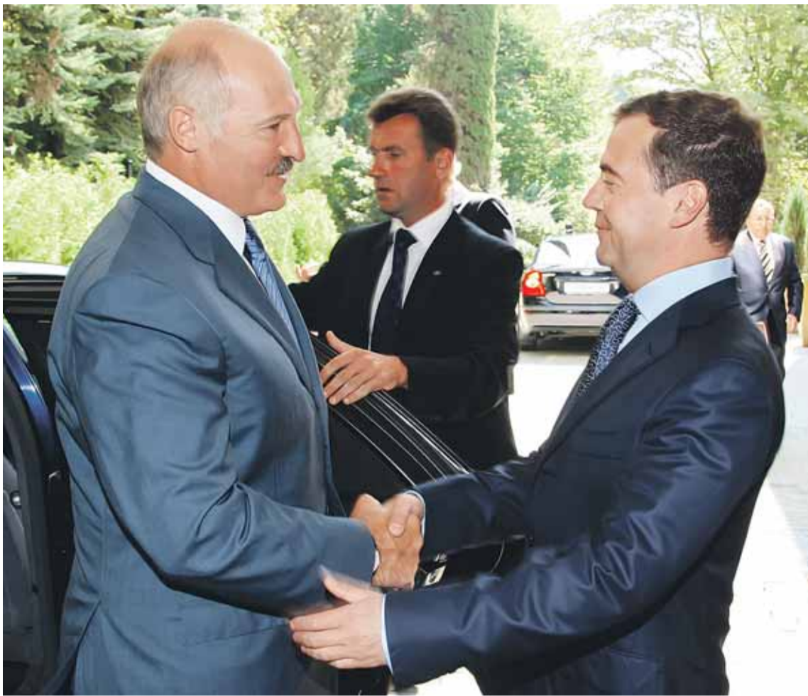
➔ ДМИТРИЙ МЕДВЕДЕВ И АЛЕКСАНДР ЛУКАШЕНКО ХОТЕЛИ БЫ ВЕРИТЬ, ЧТО ПРОБЛЕМЫ ОСТАЛИСЬ В ПРОШЛОМ