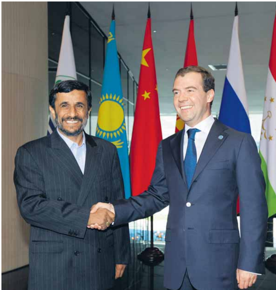
▲ ДМИТРИЙ МЕДВЕДЕВ И ПРЕЗИДЕНТ ИРАНА МАХМУД АХМАДИНЕЖАД ГОТОВЫ РАЗВИВАТЬ ВЗАИМОВЫГОДНОЕ СОТРУДНИЧЕСТВО

с 1-й стр. »» Во-первых, Иран является серьезным торгово-экономическим партнером для России и рынком сбыта ее высокотехнологической, в том числе и военно-технической продукции. Для Москвы имеет первостепенное значение сохранение кадров, рабочей силы и технологий в сфере ядерной энергетики. У Тегерана есть намерения и дальше продолжать строительство атомных электростанций. Наконец, Иран, как показывают события на Северном Кавказе, ведет себя весьма ответственно и никогда никакими своими действиями не вызывал подозрения в том, что он заинтересован в поддержке исламских экстремистов, действующих на юге России. Тегеран ни на Кавказе, ни в Центральной Азии не пытается создавать каких-либо проблем для Москвы. Неготовность России пойти на ужесточение санкций по отношению к Ирану вовсе не связана с желанием как-то навредить США. Нашим американским партнерам следовало бы понять, что Иран для нас во многих смыслах является очень важной страной и что сохранение дружеских взаимовыгодных отношений с Тегераном отвечает стратегическим интересам Российского государства. Для того чтобы Россия поступила отмеченными выше обстоятельствами в отношениях с Ираном, потребуются, чтобы американская сторона предложила нечто, что перевесило бы все то в совокупности, что сегодня имеется в российско-иранских отношениях.