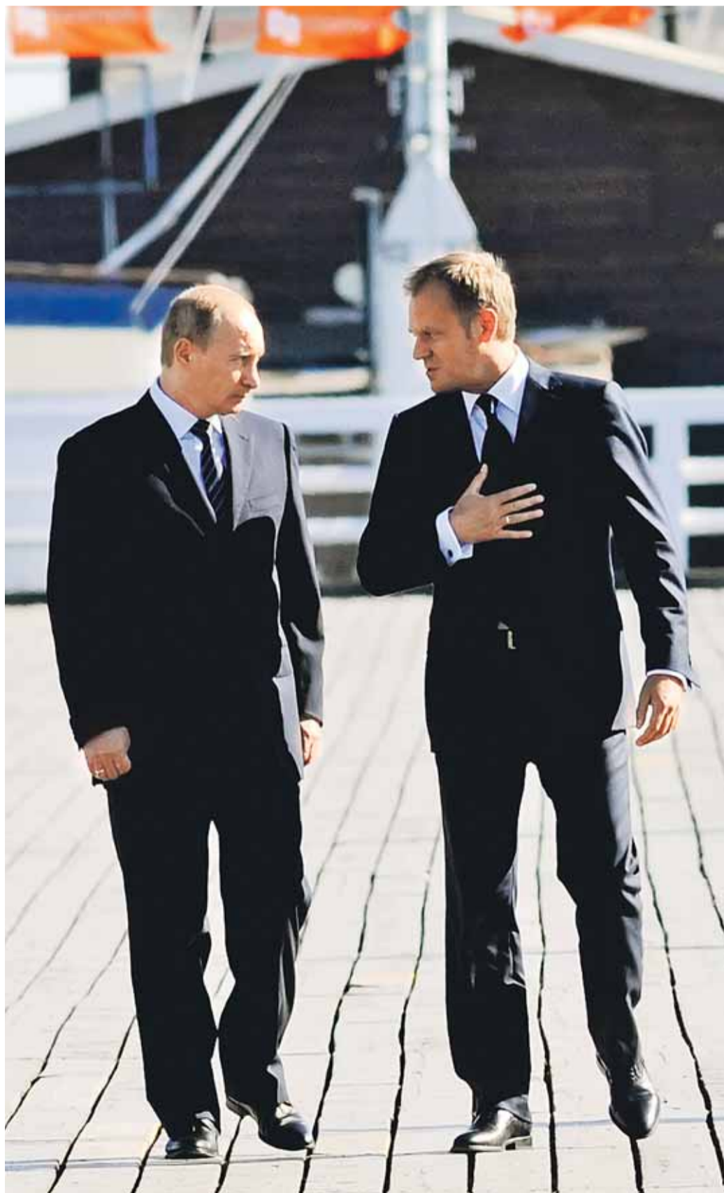
ВЛАДИМИР ПУТИН И ДОНАЛЬД ТУСК ГОВОРИЛИ НА ОДНОМ ЯЗЫКЕ

Россия и Польша пытаются «перезагрузить» отношения